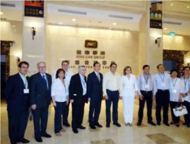
Federico Franco, presidente paraguayo, junto con los empresarios del Holding King Car, durante la visita realizada ayer domingo (tarde del lunes en Tawán).

Taiwán importará 4.000 Ton. de carne paraguaya -- TAIPEÍ (Daniel Ortiz, enviado especial). - Taiwán volverá a comprar carne paraguaya tras casi dos años de que suspendiera la importación a causa de un brote de aftosa en San Pedro. El presidente, Federico Franco, en visita oficial, hizo el anuncio de que este país asiático retomará su cupo de 4.000 toneladas del producto nacional, tras una visita a la empresa del grupo King Car, uno de los holdings empresariales más grandes de este país.